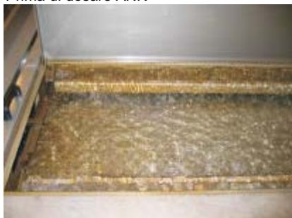
Prima di dosare ANK

- La Vostra birreria avrà un Pastorizzatore sempre pulito e libero dai batteri