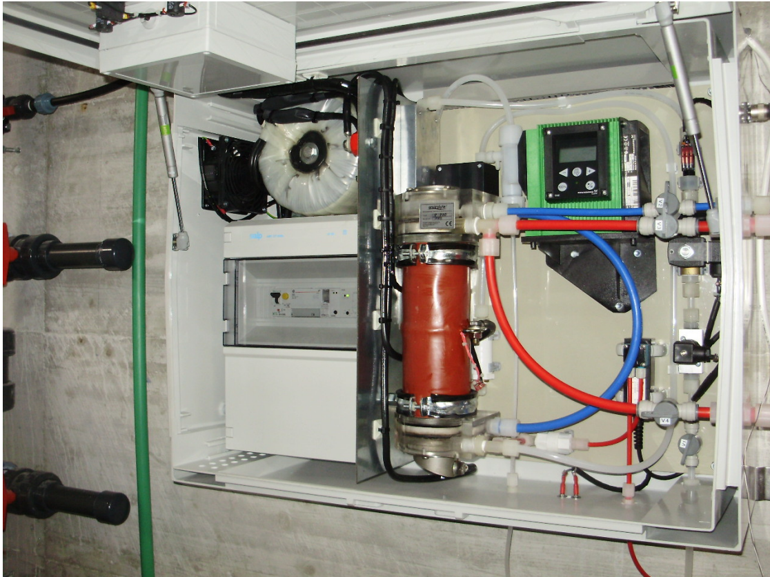
Figura 2: presentazione fotografica dello strumento Envirolyte della ditta Envirolyte con cui è stato preparato l'Anolyte con il quale si sono svolte le prove.

In questo modo vengono prodotti disinfettanti a base acido ipocloroso, normalmente immagazzinati in un serbatoio e iniettati da una pompa dosatrice nell'acqua potabile o in acque di balneazione, in una concentrazione adeguata. Nel quadro descritto in questa relazione di sintesi è stato testato l'Anolyte così prodotto per l'utilizzo in disinfezione dell'acqua potabile.