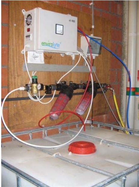
EL 900 con serbatoio di accumulo

Il Sindaco di Newport ci ha contattato per trovare una soluzione al suo problema. Abbiamo proposto l'installazione di una EL 900 attrezzata con un allarme acustico e telefonico controllati dal Redox. Quando il Redox scende sotto 550 mV, il tecnico incaricato è informato da un allarme telefonico e un allarme acustico si attiva nell'ufficio.