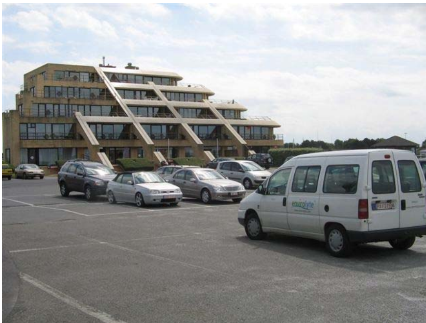
Clubhouse con i locali doccia

La clubhouse contiene 40 docce per le donne e 40 docce per gli uomini. Nel 2004, 2 uomini sono morti per l'infezione da Legionella in questo luogo. L'Autorità avrebbe chiuso il Club se i proprietari non avessero provveduto con un efficace trattamento dell'acqua.