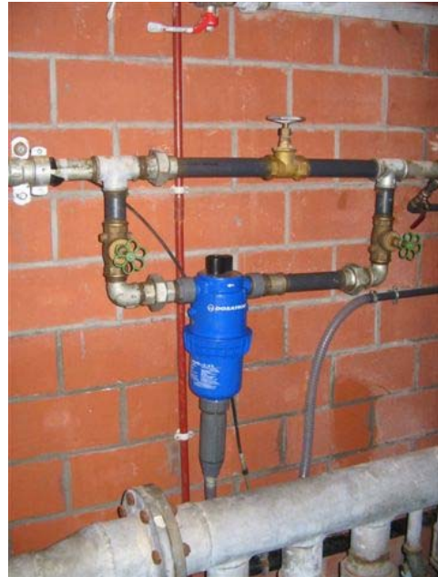
0,3% ANK iniettato con pompa dosatrice