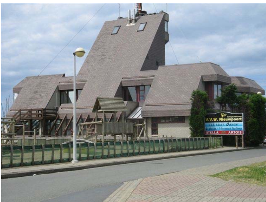
Ristorante e ufficio